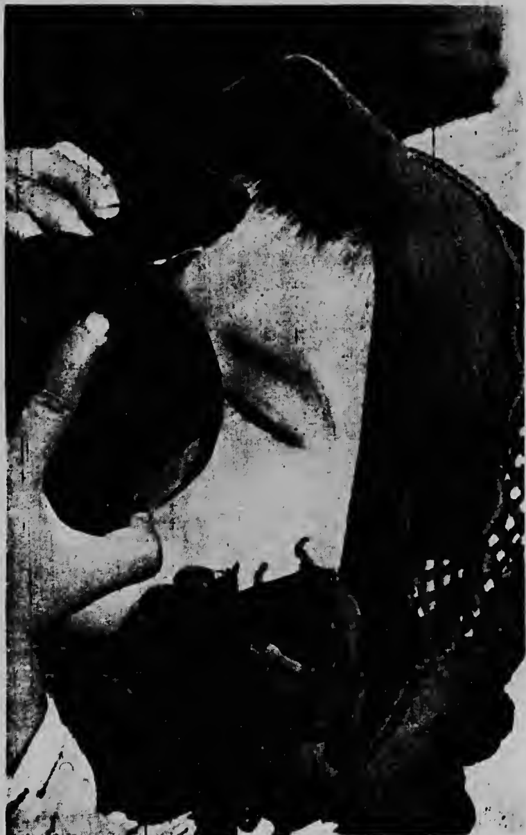
Un mucha muher Sudvietnames chikituta manda e cuminda den e blekie abao ora cu mariniernan a hanjele banda di Da Nang, mientras cu tabatin celebracion di anja nobo Lunar. Un di e costumernan tradicional di e celebracion aki ta pa parti cuminda cu tur hende cu bo topa cune den caminda.